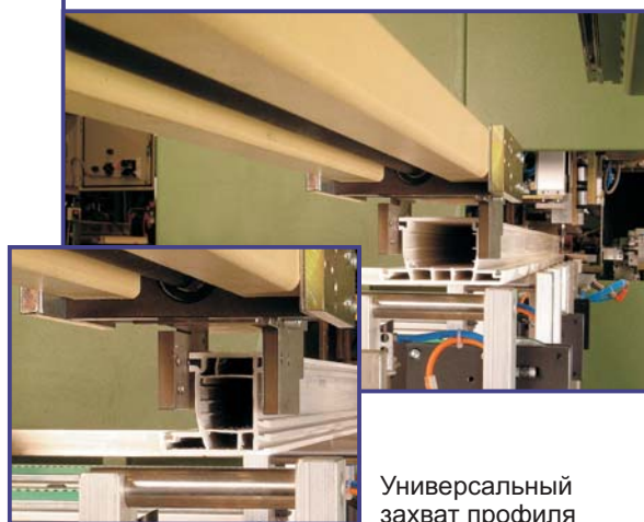
Универсальный захват профиля

Дополнительная информация на сайте www.LEMUTH.com или по телефону +49 3693 9412-0